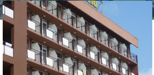
das zentrale Hotel Gladiola

Preise gelten für Flüge ab Leipzig. Alle großen deutschen Flughafen möglich, jedoch muss mit Zuschlägen von 0-70 € gerechnet werden. Einfach anfragen.