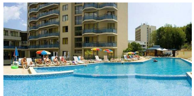
der Poolbereich im Hotel Royal