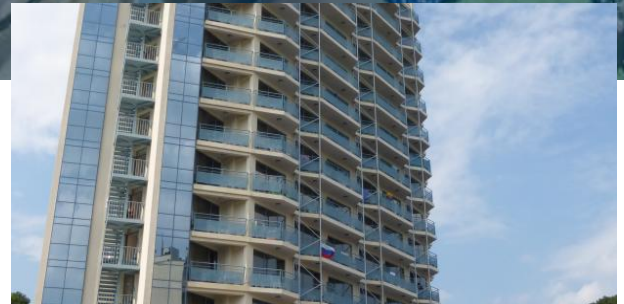
das schöne Hotelgebäude

Preise gelten für Flüge ab Leipzig. Alle großen deutschen Flughäfen möglich, jedoch muss mit Zuschlägen von 0-70 € gerechnet werden. Einfach anfragen.